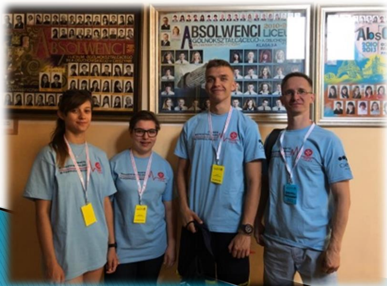
V m. w Polsce w Mistrzostwach Pierwszej Pomocy – nasza szkolna drużyna medyczna