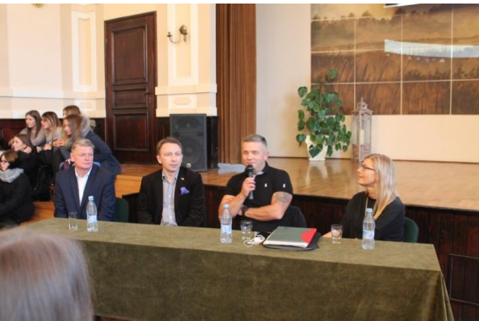
Spotkanie z pływakiem ekstremalnym

Szkoła realizuje edukację zdrowotną i program profilaktyki dla uczniów, nauczycieli i innych pracowników szkoły oraz dąży do poprawy skuteczności działań w tym zakresie.