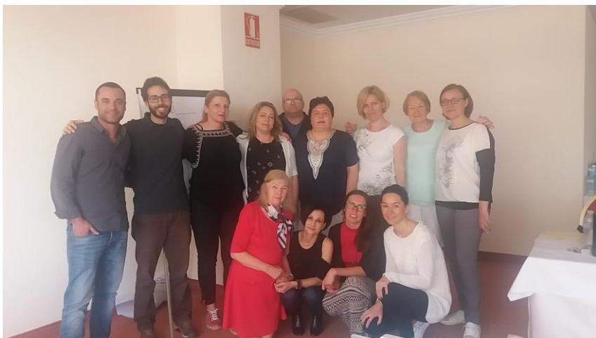
Nasi nauczyciele w Finlandii...