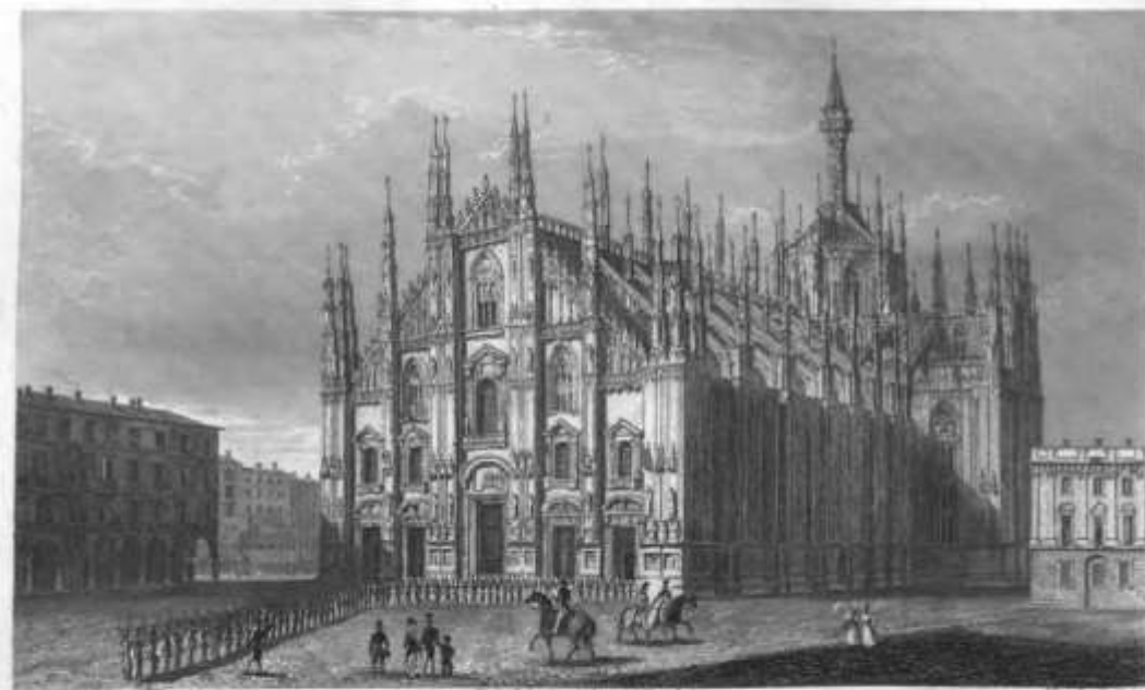
LES POLONAIS à MILAN.

Dowództwo nad Legionami powierzono gen. Janowi Henrykowi Dąbrowskiemu